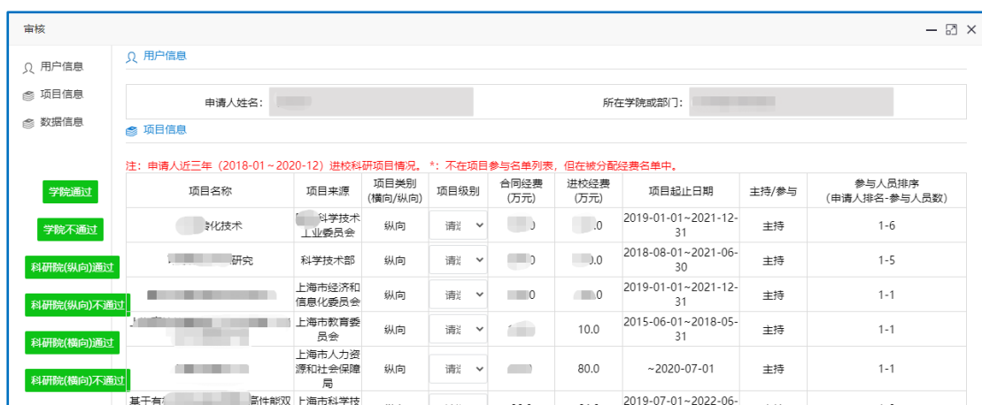
图 3 学院审核界面

2. 若为“学院秘书”角色：点击“博导遴选管理”，进入页面后，点击“学院通过”按钮，审核老师申请的项目信息，只能审核本学院的申请信息，学院审核不加签名不加电子章。