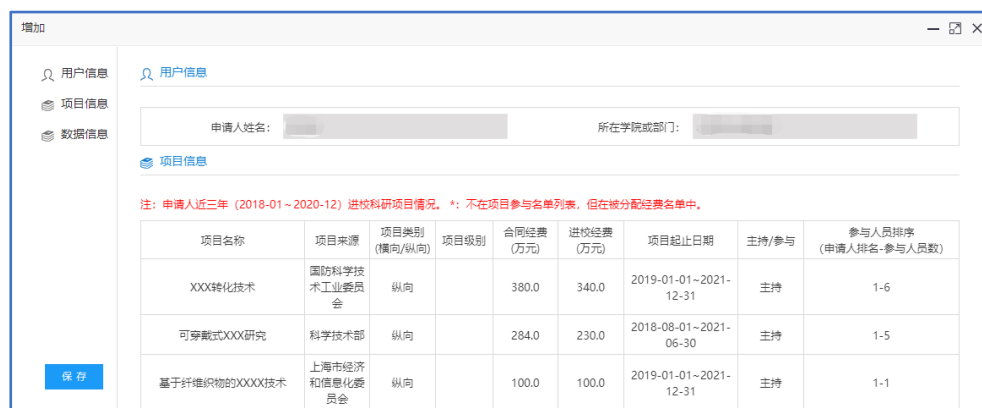
图2 新增博导遴选科研项目审核表

1. 若为“教师”角色：点击“我的博导遴选”，进入页面后，点击“增加”按钮，自动生成申请人近三年进校科研项目情况，核对无误后，点击“保存”按钮。